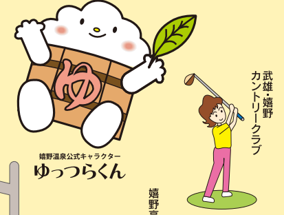
嬉野温泉公式キャラクター ゆつらくん カントリークラブ