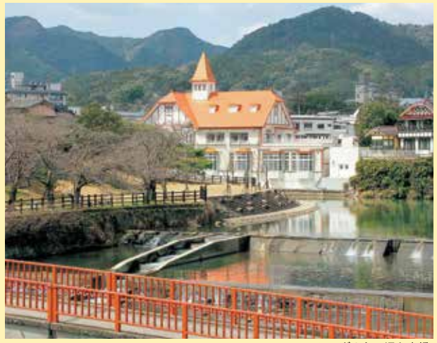
シーボルトの湯と赤橋